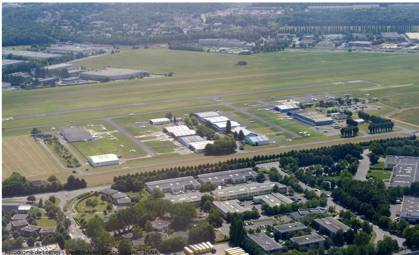
Aérodrome de Lognes

Mercredi 4 octobre 2023 – 8h20/18h Amphithéâtre Farman de la DGAC, Paris 15ème